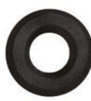
3.201.00 Kleberosette in Schwarzstahl-Optik*